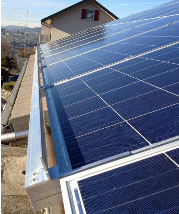
Schneefang unterste Reihe

Nach Plänen von Dachdecker DL Swiss Dach AG, 8717 Benken